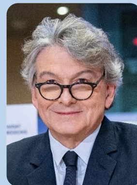
THIERRY BRETON, Komisarz do spraw rynku wewnętrznego:

Bez uszczerbku dla kompetencji państw członkowskich w zakresie bezpieczeństwa narodowego Komisja zastosowała również kryteria zestawu narzędzi w celu oceny potrzeb i słabych punktów jej własnych systemów komunikacji instytucjonalnej oraz podobnych systemów innych instytucji,