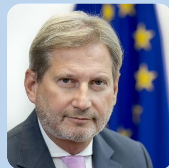
JOHANNES HAHN , Komisarz do spraw budżetu i administracji:

Budżet UE nadal zapewnia Europie środki, które pomogą jej sprostać obecnym i przyszłym wyzwaniom. Budżet ten, podobnie jak budżety krajowe, boryka się jednak z ograniczeniami wynikającymi z rosnących kosztów, podczas gdy potrzeby finansowe nie maleją. Budżet UE na 2024 r. opracowano z myślą o tym, by nadal wspierać zieloną i cyfrową transformację Unii, i pozostaje on jednym z najskuteczniejszych narzędzi przynoszących wyraźną poprawę życia obywateli.