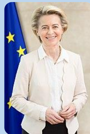
URSULA VON DER LEYEN Przewodnicząca Komisji Europejskiej:

Rolnicy w UE odczuwają również korzyści nie tylko w związku z obniżką ceł. W ramach umowy chronione będą nazwy wszystkich unijnych win i alkoholi (prawie 2 000 nazw), takich jak Prosecco, Polish Vodka, Rioja, Champagne i Tokaji. Ponadto chronione w Nowej Zelandii będzie 163 najbardziej uznanych tradycyjnych produktów UE (oznaczenia geograficzne), takich jak sery Asiago, Feta, Comté czy Queso Manchego, szynka Istarski pršut, marcepan Lübecker Marzipan, czy też oliwki Elia Kalamatas.