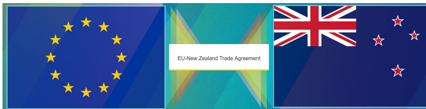
Zdjęcie: Strona poświęcona umowie handlowej między UE a Nową Zelandią

Umowa w pełni uwzględnia interesy unijnych producentów wrażliwych produktów rolnych: niektórych produktów mlecznych, wołowiny i baraniny, etanolu i kukurydzy cukrowej. W przypadku tych sektorów nie będzie liberalizacji handlu. Zamiast tego umowa przewiduje zerowe lub niższe stawki celne na produkty importowane z Nowej Zelandii tylko dla ograniczonych ilości (tzw. kontyngenty taryfowe).