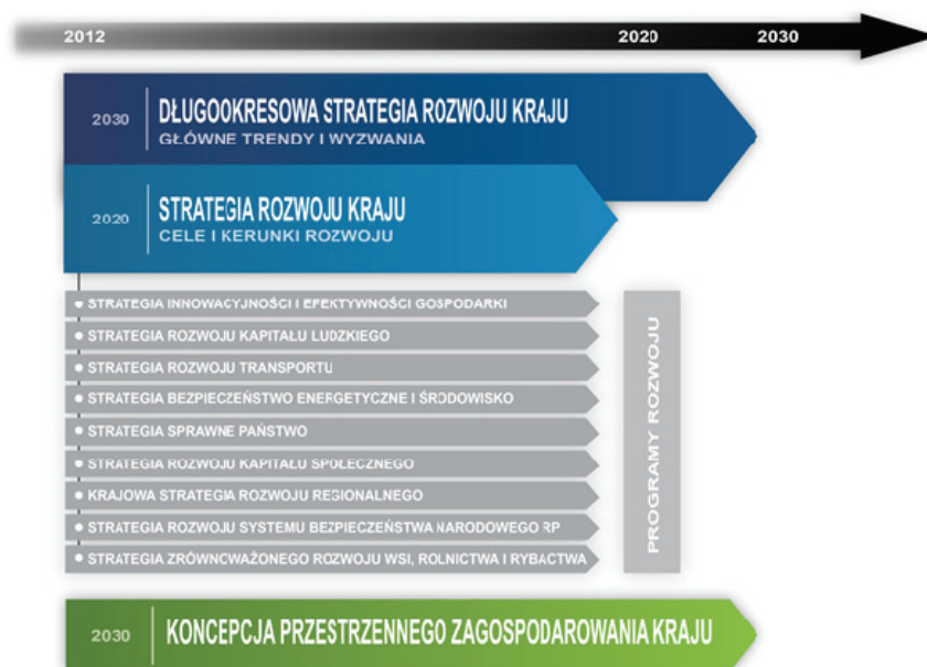
Schemat 1: System krajowych dokumentów strategicznych.

Ramy przestrzenne dla prowadzenia polityki rozwoju w Polsce, w tym realizacji poszczególnych strategii rozwojowych stanowi KPZK, przyjęta przez Radę Ministrów 13 grudnia 2011 r. Jest to główny dokument strategiczny kreujący ład przestrzenny w Polsce oraz porządkujący zagadnienia związane z rozwojem, w którym przestrzeń traktowana jest jako płaszczyzna odniesienia dla działań rozwojowych. Powiązania pomiędzy krajowymi dokumentami strategicznymi pokazuje poniższy schemat.